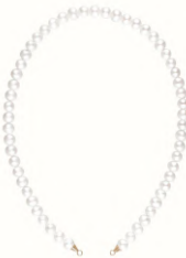
Fay moon (short or long)

¥72,600 or ¥77,000 K14YG 全長/約40.0～41.5cm or 約46.5cm 淡水パール/最小約8.5mm