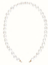
Fay rock (short or long)

¥72,600 or ¥77,000 K14YG 全長/約40.0～41.5cm or 約46.5cm 淡水パール/最小約8.5mm