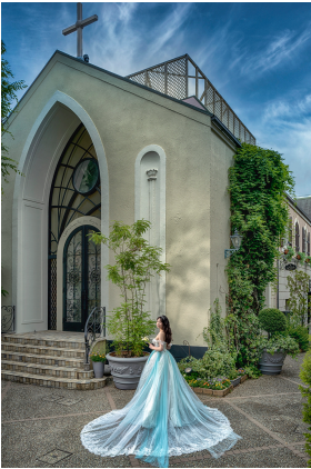
南青山ル・アンジェ教会 <東京・表参道>

その他¥350,000～、¥450,000～のプランもご用意しております。 お選びいただいたプランによって着用いただけるドレスは異なりますので、 詳細はドレスサロンへお問い合わせくださいませ。