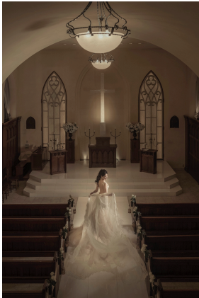
南青山ル・アンジェ教会<東京・表参道>

国内外のウエディング、MICEマネジメント、レストラン事業をはじめ、ホスピタリティを持って上質なライフスタイルを提案するTAKAMI GROUPのTAKAMI BRIDAL（本社：京都市下京区、代表 高見重光）の運営するCouture Wedding Salon 「MAGNOLIA WHITE（マグノリア・ホワイト）」は、オープン5周年を記念して、初めてオリジナルフォトプランを販売いたします。