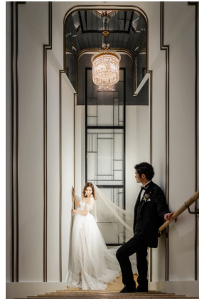
THE DRAPE shinsaibashi<大阪・心齋橋>